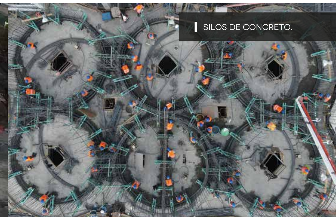
SILOS DE CONCRETO.